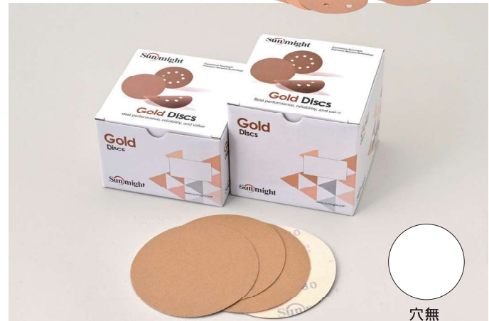
ディスクマジックタイプ 穴無 SIZE:125mm