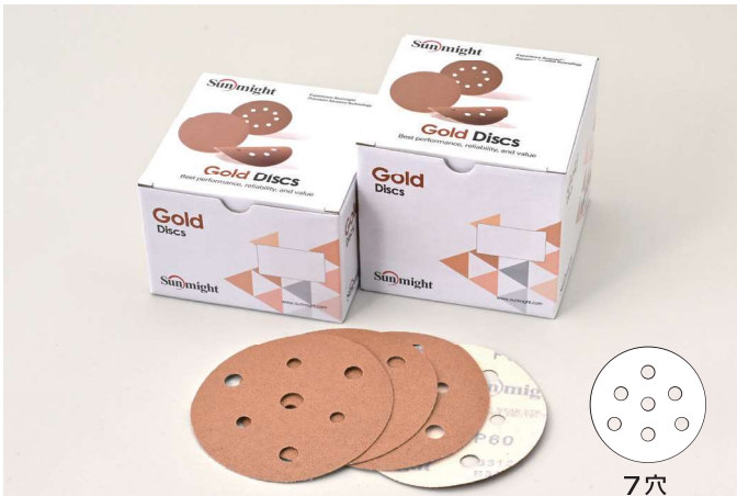
ディスクマジックタイプ 7穴 SIZE:125mm