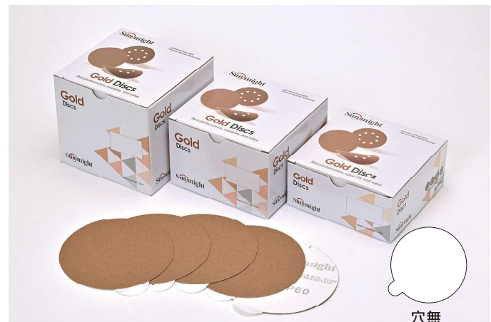
ディスクのりタイプ 穴無 SIZE:125mm