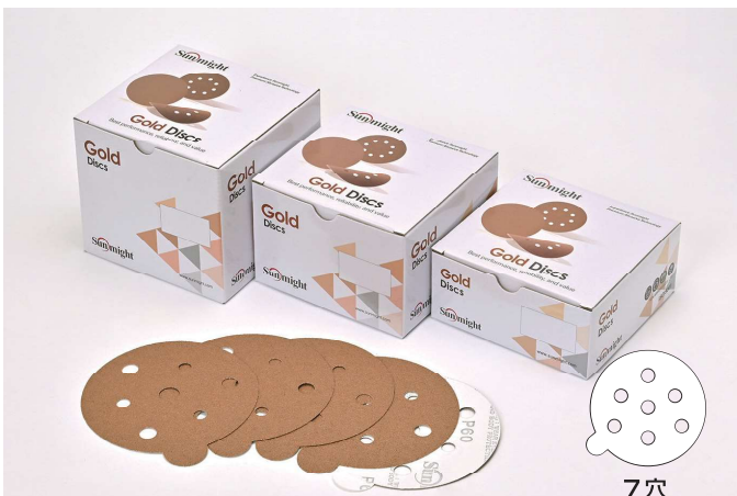
ディスクのりタイプ 7穴 SIZE:125mm