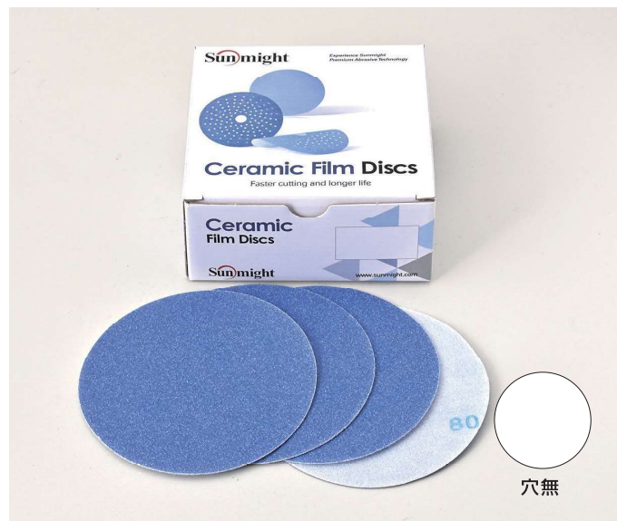
ディスクマジックタイプ 穴無 SIZE:125mm