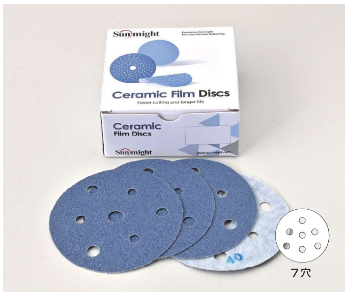
ディスクマジックタイプ 7穴 SIZE:125mm