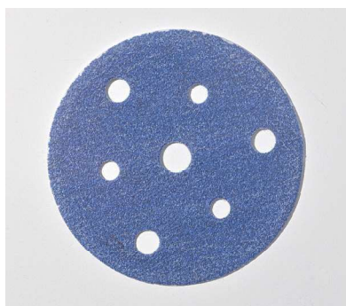
Sunmight Ceramic Film