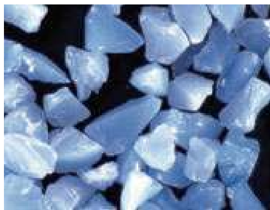
Sunmight Ceramic Film ディスク拡大図

高品質な粒子と強力な樹脂結合により、他社製品よりも早い切断性能と長寿命が実現しました。破れに強く、エッジ、コーナ一部などの不規則な形状に最適です。フィルム基材は非常に強く耐久性に優れ、乾式及び湿式研磨の両用途に対応します。カラミ防止剤をメトロ処理することによりカラミが少ないのが特徴で、パテ研磨・溶剤研磨・金属素地研磨・錆取り・黒皮研磨など幅広い素材に対応します。